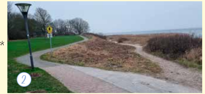
Bauhofkamera 2: Wieder voller Durchblick für Radfahrer und Fußgänger dank Rückschnitt.