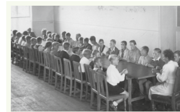
Speisesaal um 1953

dische Saal“ mit 26 Betten, ebenfalls wegen der Zuwendung des Holländischen Roten Kreuzes. Im zweiten Stock liegt das Zimmer „Molenblick“ mit 10 Betten, gegenüber das Zimmer „Sperlingshöh“ ebenfalls mit 10 Betten. Weiter gibt es das Zimmer „Blinkfeuer“ wegen des Leuchtturmes des Bülker Leuchtturmes, das durch die Zimmer scheint, sowie die Zimmer „Villa Möwennest“, „Probsteier Döns“ (Probsteier gute Stube) und das Krankenzimmer, welches aber immer ungern von den Kindern bewohnt wurde. Natürlich gibt es Einzelzimmer für