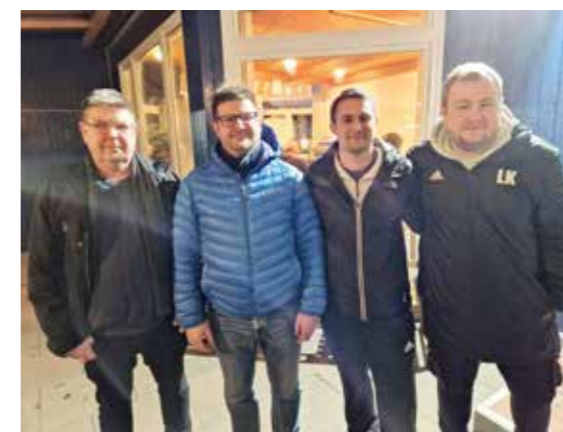
Fußballabteilung mit neuen Trainern