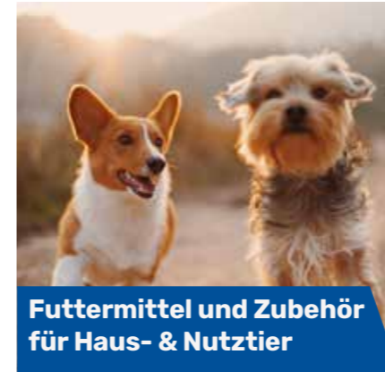
Futtermittel und Zubehör für Haus- & Nutztier

Für den Vorstand Günter Grotzcek Vorsitzender