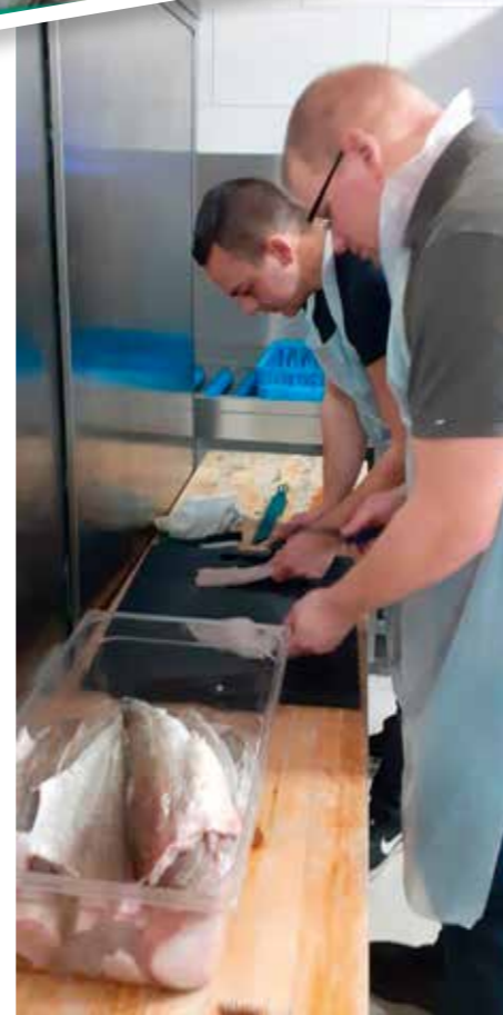
Kabeljauschlachten einen Tag vorm Dorschball.

Einige kleinere Aktivitäten für die Vereinsmitglieder sind geplant, z.B. eine Unterweisung in Fischfiletieren, Räuchern etc. Am 08.07.23 ist wieder ein Fischerfest geplant, zugesagt haben bereits Shantychor und Livemusik, es gibt natürlich wieder Fisch und andere Nahrungsmittel in fester und flüs-