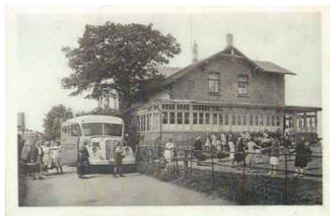
Ankunft der Kinder um 1950

Die Küchenarbeit wurde von den Müttern der Schüler ehrenamtlich übernommen, so dass alles Geld für einen Klassenaufenthalt und für das leibliche Wohl verwendet wurde.