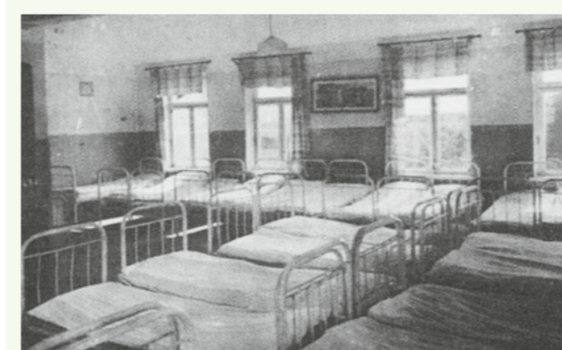
Schlafräume „Holländer“ 26 Betten um 1953

Die Kinder werden heutzutage mit ihrem Gepäck in Autobussen von Hamburg nach Stein gebracht, aber am Kochtopf stehen immer noch die ehrenamtlichen Mütter und sorgen dafür, dass auch alle satt werden. Die Zimmer im Ostseeheim haben alle einen Namen statt Nummern. Sie sind im Namen eines Kinderpreisausschreibens entstanden und heißen im Erdgeschoss „Hamburger Saal“ mit 25 Betten auf Grund der Geldzuwendung der Stadt Hamburg. Eine Treppe höher der „Hollän-