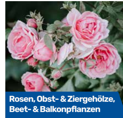
Rosen, Obst- & Ziergehölze, Beet- & Balkonpflanzen