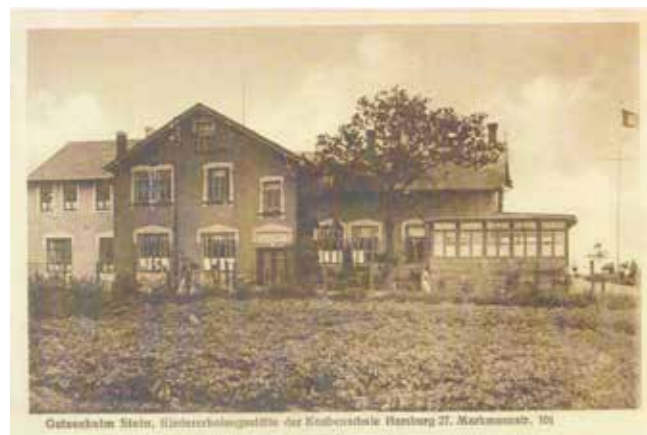
Ostseeheim vor 1930