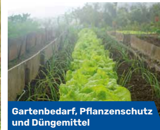
Gartenbedarf, Pflanzenschutz und Düngemittel