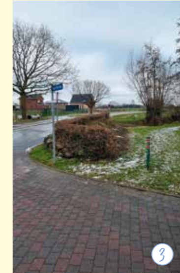
Bauhofkamera 3+4: Knickschnitt an vielen Stellen in Stein.