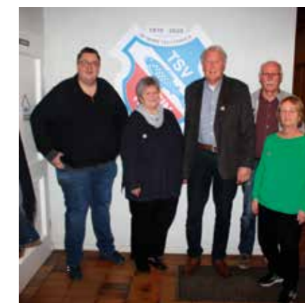
Ehrung für 50 Jahre Mitgliedschaft