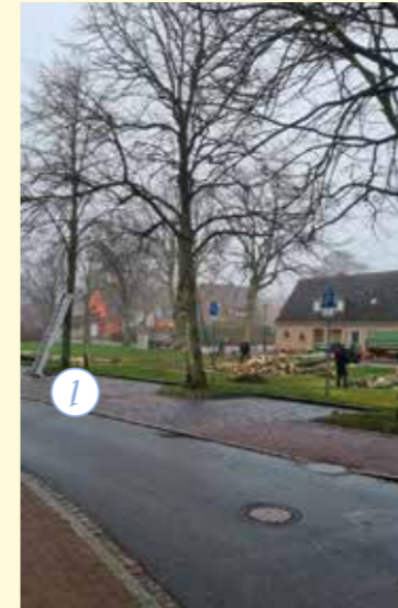
Bauhofkamera 1: Am Dorfring mussten leider einige kranke Bäume gefällt werden. An diesen Stellen werden wieder neue Bäume gepflanzt.