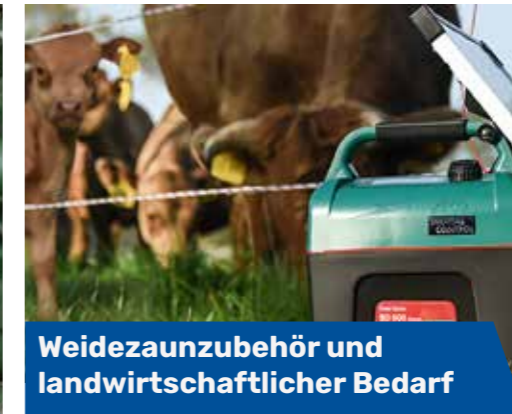
Weidezaunzubehör und landwirtschaftlicher Bedarf