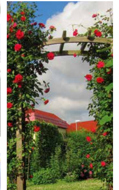
Dekoration und vieles mehr