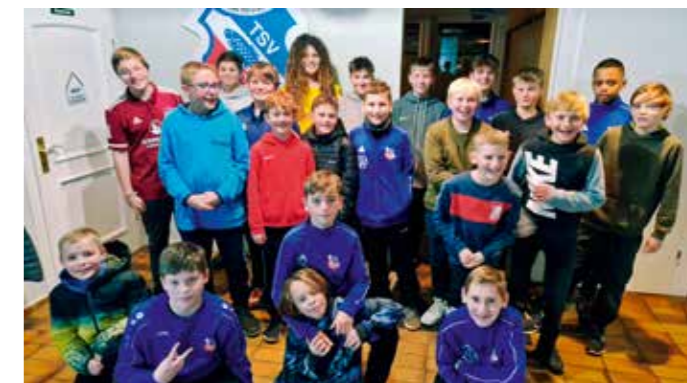
Weihnachtsfeier der D-Jugend

Unsere D/C-Jugend hatte eine schöne Weihnachtsfeier im Sportheim Stein, mit Spiel, Sport und viel leckerem Essen. Die