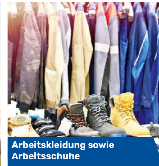
Arbeitskleidung sowie Arbeitsschuhe