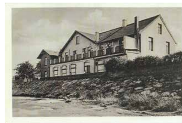
Ostseeheim, alter Deich um 1950

Im 2. Weltkrieg wurde das Heim von der Marine belegt und danach wurden Flüchtlinge aus den deutschen Ostgebieten dort einquartiert. Erst 1949 wurde das Ostseeheim wieder frei. Da die Schule in der Marckmannstraße im Krieg ausgebombt wurde, beteiligten sich jetzt mehrere Hamburger Schulen an der Verwaltung und der Unterhaltung. Viele Neuanschaffungen waren jetzt von Nöten und alles musste renoviert werden. Ein neuer Brunnen und eine neue Toilettenanlage wurden gebaut. Mit Geldern der Hamburger Schülerfürsorge konnten viele neue Betten angeschafft werden. Die neueste Errungenschaft besteht aus einem neuen großen Waschraum.