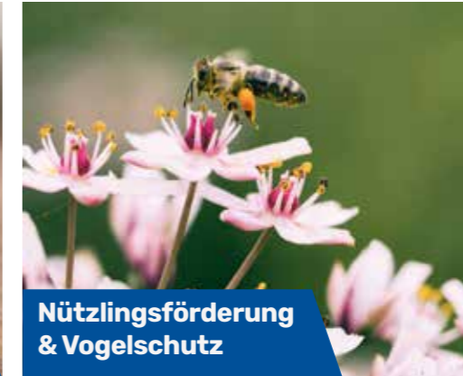
Nützlingsförderung & Vogelschutz